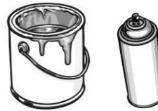
Peinture et teinture résidentielle, vernis, laque, aérosol, solvant