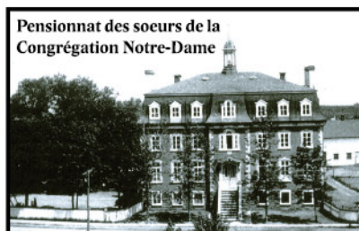
Pensionnat des soeurs de la Congrégation Notre-Dame

Et c'est encore le fleuve (goélettes, bateaux à vapeur) qui les transporte à Québec, gens et marchandises, jusqu'à l'avènement du « macadam », vers 1923.