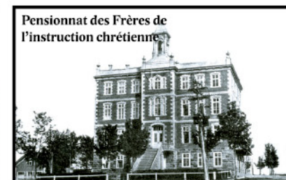
Pensionnat des Frères de l'Instruction chrétienne

Le premier pensionnat de filles naît dans le vieux presbytère (1849), sur le site actuel du couvent. Un incendie force la construction d'un nouvel édifice (1886) sur le même site. Dès 1909, le pensionnat doit s'agrandir et est reconnu officiellement École moyenne familiale en 1941. Pépinière de vocations, il abritera les religieuses jusqu'en 1991.