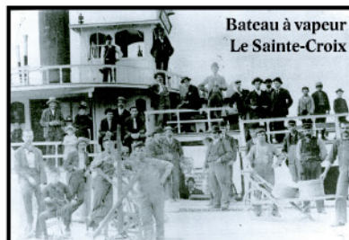
Bateau à vapeur Le Sainte-Croix