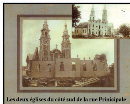
Les deux églises du côté sud de la rue Principale

En haut de la falaise, l'église construite (1740) dans le secteur de l'actuel hôtel de ville est remplacée (1839) par celle qu'on voit ici en cours de démolition. Vers 1910, certains la trouvant dangereuse, on construit l'actuelle (1911). Remarquez la façade qui se tourne de l'ouest vers le nord.