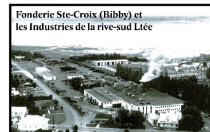
Fonderie Ste-Croix (Bibby) et les Industries de la rive-sud Ltée

En haut de la falaise, l'église construite (1740) dans le secteur de l'actuel hôtel de ville est remplacée (1839) par celle qu'on voit ici en cours de démolition. Vers 1910, certains la trouvant dangereuse, on construit l'actuelle (1911). Remarquez la façade qui se tourne de l'ouest vers le nord.