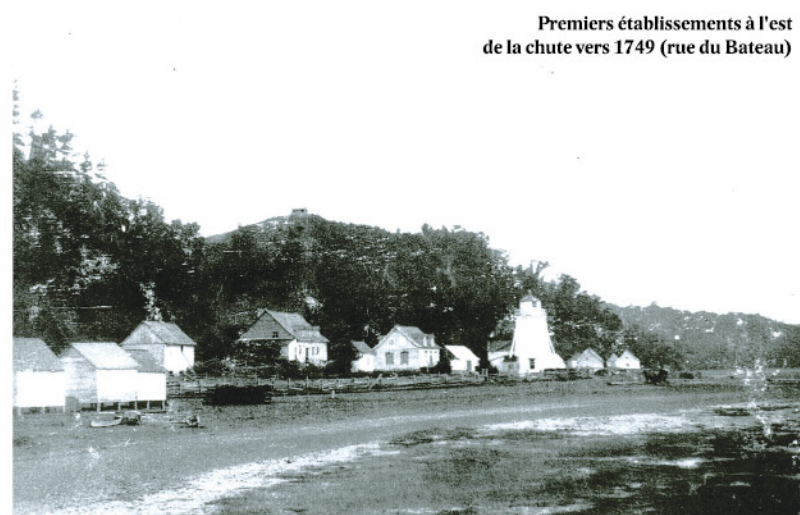
Premiers établissements à l'est de la chute vers 1749 (rue du Bateau)

Ce projet a été rendu possible grâce à la contribution de la municipalité et de ses partenaires.