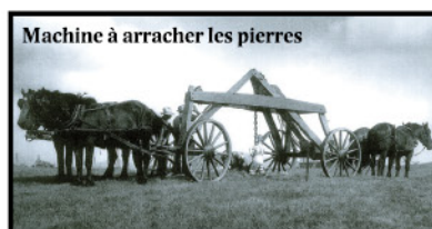
Machine à arracher les pierres