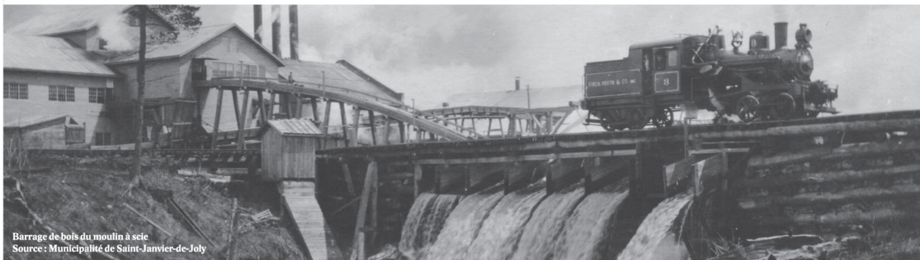
Barrage de bois du moulin à scie

Ce projet a été rendu possible grâce à la contribution de la municipalité et de ses partenaires.