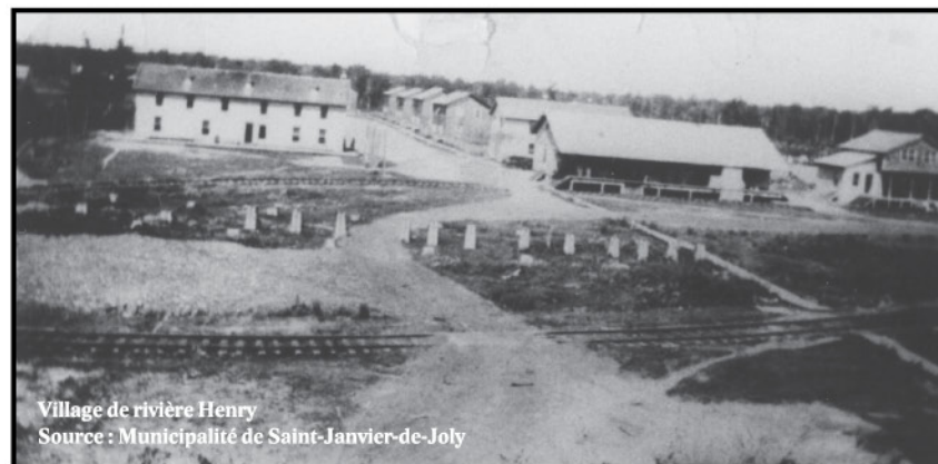
Village de rivière Henri