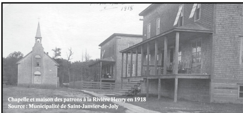
Chapelle et maison des patrons à la Rivière Henri en 1918