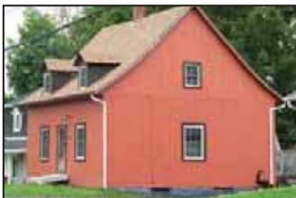
Maison québécoise datant de 1879 et située sur la rue principale.

Sur l'ensemble des 1 049 maisons étudiées à partir des données du rôle d'évaluation foncière, on constate que 8 % d'entre elles datent d'avant 1900, soit au début du développement de ce secteur, alors que 15 % des demeures ont été construites entre 1900 et 1949. L'expansion récente de la municipalité se traduit par 77 % des maisons qui ont été érigées entre 1950 et nos jours. Bien que l'architecture moderne (bungalows, maisons préfabriquées) soit dominante, on retrouve tant dans la trame villageoise que dans les rangs un grand nombre de maisons d'intérêt patrimonial qui relatent les débuts de Saint-Agapit.