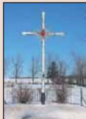
Croix de chemin du rang Saint-Pierre.

Ces lieux de culte populaires, que l'on retrouve à la croisée des chemins, sont ainsi préservés et mis en valeur.