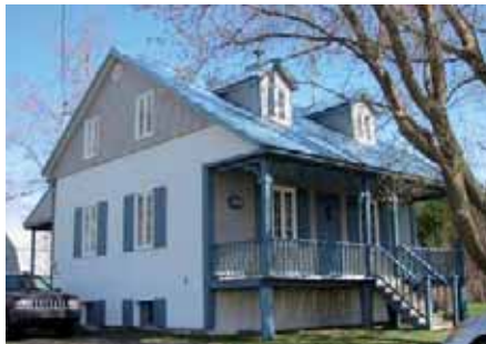
Très bel exemple de préservation d'une demeure construite en 1930 dans le 3 e -4 e rang ouest. Le style et les matériaux d'origine ont été respectés.

Des 438 maisons étudiées au rôle d'évaluation de la municipalité, 153 (35 %) datent des débuts de la colonisation et ont été construites avant 1950. Entre 1950-1974, ce sont 109 maisons (25 %) qui s'ajouteront au noyau villageois. De 1975 à nos jours, 176 autres maisons (40 %) viendront consolider le village.