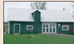
Forge Demers située au 305, rue Principale

La municipalité de N.-D.-S.-C. d'Issoudun possède donc un fort potentiel d'interprétation des métiers traditionnels avec la possible mise en place de centres d'interprétation. Le principal défi d'une entité qui voudrait développer un tel attrait de tourisme culturel (corporation à but non lucratif ou municipalité) consiste en la recherche de financement pour la mise à norme de ces bâtiments ainsi que leur opérations. Mais, il va sans dire que ce serait un projet très intéressant qui pourrait, de plus, se greffer au musée de miniatures d'instruments aratoires qui comporte plus de 150 pièces sculptées sur bois par M. Isidore Boisvert. Un volet de mise en valeur du patrimoine vivant pourrait même être réalisé avec une programmation d'artisans traditionnels à l'œuvre.