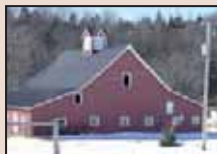
Ferme Champagne du rang Armagh.

La vocation agro-forestière de Sainte-Agathe-de-Lotbinière est manifeste. Lorsque l'on circule dans les rangs de la municipalité, on réalise la place qu'a occupée l'agriculture pour les premiers habitants et leurs descendants. On dénombre de beaux bâtiments agricoles bien préservés. Mentionnons l'étable d'inspiration américaine située au cœur de l'ancien village de New Armagh, datant de la deuxième moitié du 19 e siècle, et situé sur le rang du même nom.