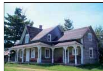
Maison du rang Armagh qui a servi au tournage de l'émission de l'Arche de Noé. Elle est maintenant inhabitée.

On remarque en certains endroits que les terres situées en ces buttes appalachiennes étaient arides et peu propices à l'agriculture. Amoncements et clôtures de pierres constitués en font foi. Quelques terres sont maintenant revenues en friche et certaines familles ont quitté, laissant derrière elles des bâtiments abandonnés victimes de l'usure du temps. Leur recyclage, qui plus est en zone agricole, constitue un défi urbanistique pour les intervenants de la municipalité.