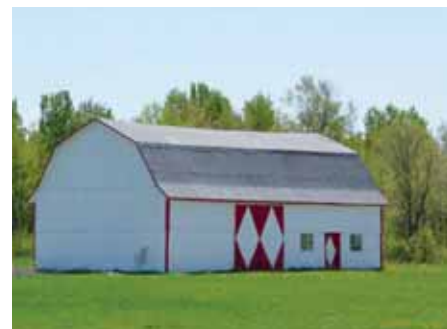
Deux beaux exemples de granges bien préservées. Elles contribuent à la trame architecturale et historique agricole de Saint-Janvier-de-Joly. Celle du haut a été construite en 1938 sur la rue Principale. Celle du bas est remarquable avec son toit mansardé. Elle a été construite en 1954 sur le 3 e et 4 e rang ouest.