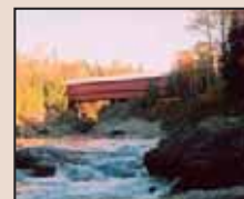
Pont couvert de la rivière Palmer (photo : Hélène Vachon).

Déjà mis en valeur grâce au comité des chutes de Sainte-Agathe-de-Lotbinière, le pont rouge de la rivière Palmer a été protégé en 2006, en vertu de la Loi sur les biens culturels. En effet, la municipalité a procédé à la citation municipale de ce magnifique pont couvert, d'une longueur de 39,9 mètres, construit en 1928. À l'époque, on construisait les ponts en bois et on les recouvrait afin de prolonger leur durée de vie.