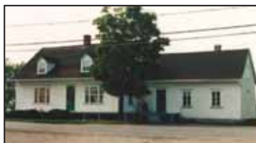
Sur la rue Principale, une des vieilles maisons (construite vers 1846) de la municipalité.