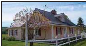
Maison de la route Sainte-Marie construite en 1828.

L'authenticité préservée de ce milieu de vie permet de mettre en place certaines actions de mise en valeur du patrimoine bâti et de l'histoire locale. La sensibilisation pourrait être une avenue envisagée. Déjà la municipalité est devenue membre de la Corporation des chemins Craig et Gosford et des comités tentent de mettre de l'avant la présence de cette municipalité dans le circuit. Des panneaux d'interprétation ou un circuit présentant l'histoire locale et ses principales attractions contemporaines pourraient voir le jour. D'autre part, la municipalité et le comité d'urbanisme pourraient éventuellement envisager la protection de certains immeubles jugés importants pour la collectivité par voie de citation municipale.