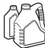
Contenants fermés d'huile à moteur et végétale