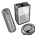
Piles et batteries rechargeables ou à usage unique, piles de cellulaire

Service offert aux citoyens de la MRC de Lotbinière et des municipalités de Deschaillons-sur-St-Laurent, Fortierville, Parisville et Sainte- Françoise seulement.