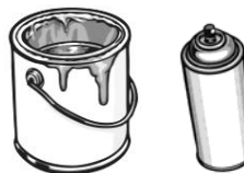
Peinture et teinture résidentielle, vernis, laque, aérosol, solvant