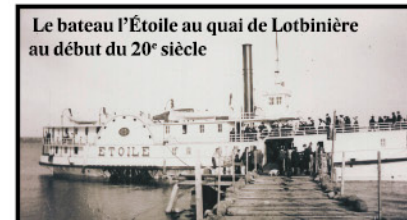
Le bateau l'Étoile au quai de Lotbinière au début du 20 e siècle