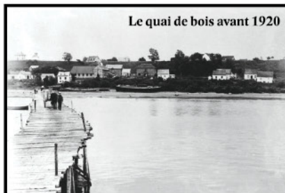
Le quai de bois avant 1920