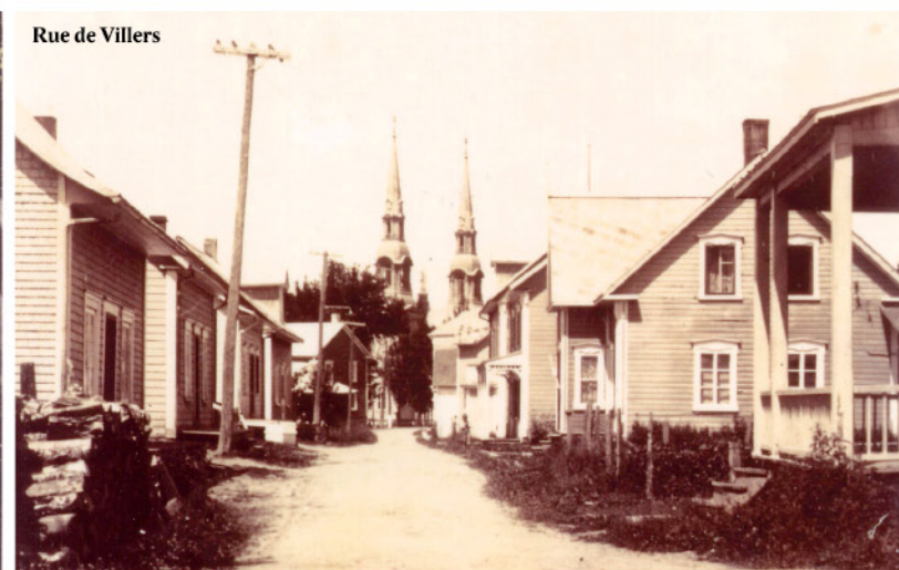
Rue de Villers

Ce projet a été rendu possible grâce à la contribution de la municipalité et de ses partenaires.