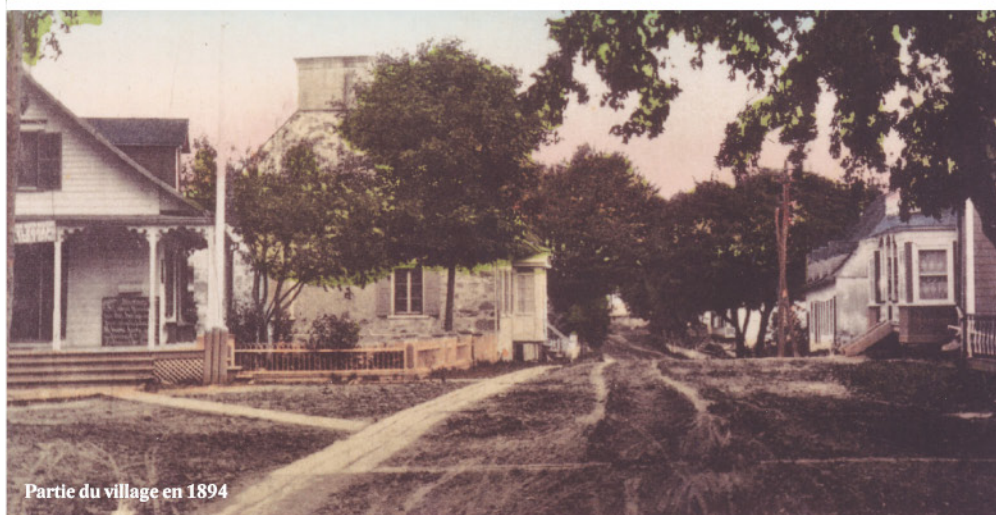
Partie du village en 1894