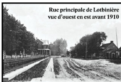
Rue principale de Lotbinière vue d'ouest en est avant 1910

Pendant plusieurs années, les habitants de Lotbinière ont été cultivateurs ou navigateurs. Par la richesse de ses terres agricoles et avec le fleuve Saint-Laurent à ses pieds, Lotbinière a toujours su tirer profit de ses deux forces économiques jusqu'au milieu du 20 e siècle. De nos jours, l'agriculture y occupe toujours une grande place, mais le village a davantage une vocation résidentielle et de villégiature.