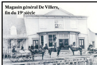
Magasin général De Villers, fin du 19 e siècle