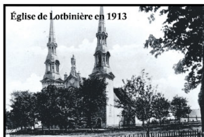
Église de Lotbinière en 1913