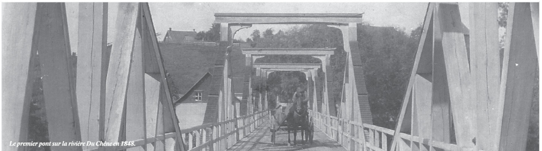
Le premier pont sur la rivière Du Chêne en 1848.

Ce projet a été rendu possible grâce à la contribution de la municipalité et de ses partenaires.