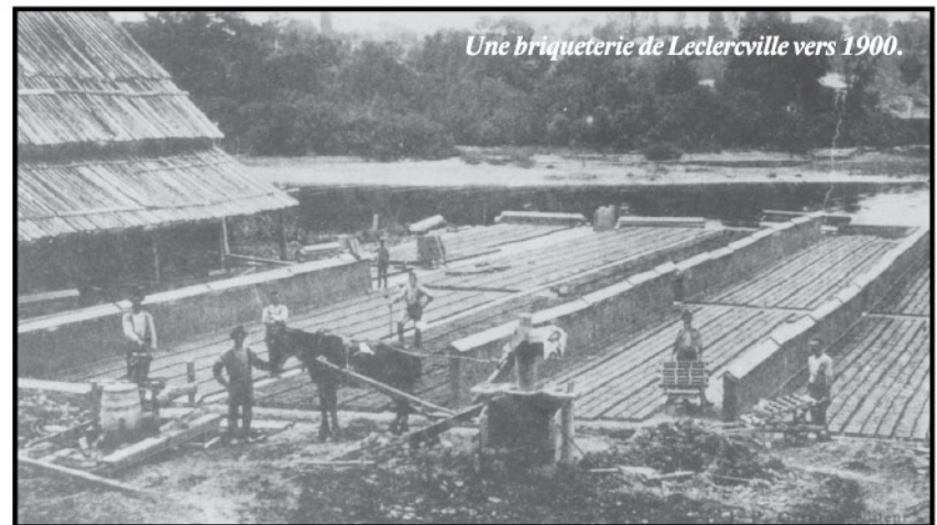
Une briqueterie de Leclercville vers 1900.