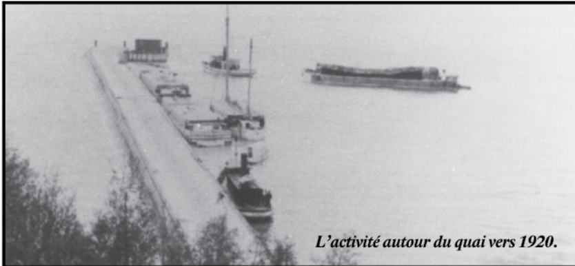
L'activité autour du quai vers 1920.