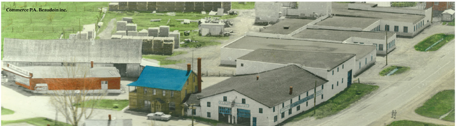
Commerce P.A. Beaudoin inc.

Ce projet a été rendu possible grâce à la contribution de la municipalité et de ses partenaires.