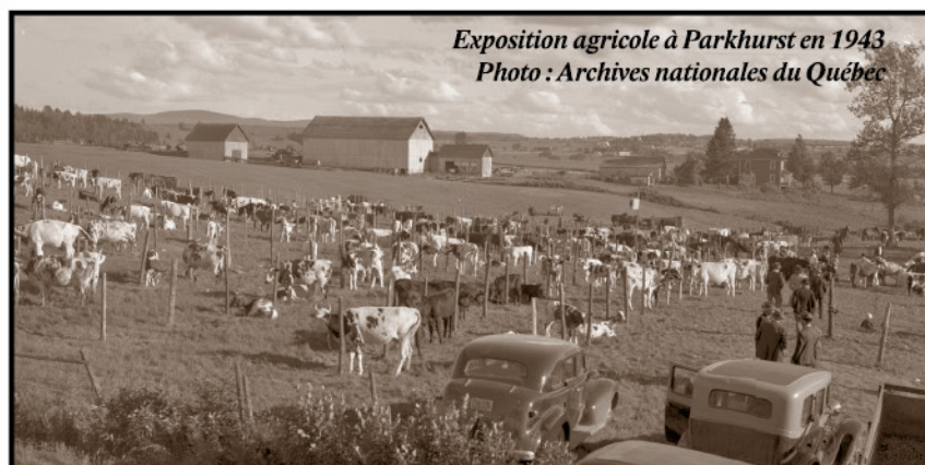
Exposition agricole à Parkhurst en 1943