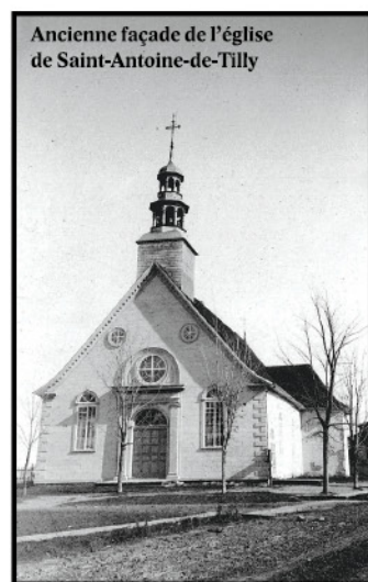
Ancienne façade de l'église de Saint-Antoine-de-Tilly

Saint-Antoine fut assiégé par les Anglais lors de la guerre de la Conquête. Le major général James Murray établit son campement en août 1759 à la mi-hauteur de la falaise, dans les Fonds, et 1 000 soldats s'installèrent dans l'église.