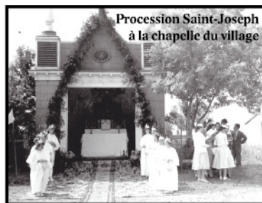
Procession Saint-Joseph à la chapelle du village