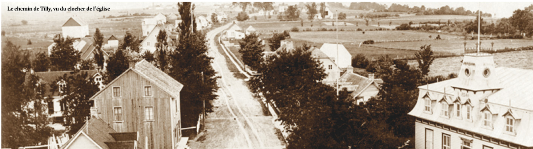
Le chemin de Tilly, vu du clocher de l'église

Ce projet a été rendu possible grâce à la contribution de la municipalité et de ses partenaires.