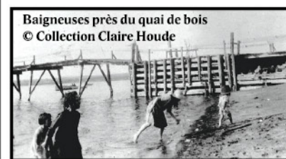
Baigneuses près du quai de bois