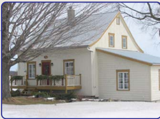
LAURÉAT - SYLVIE BERNARD ET GHISLAIN ABEL (948, Gosford est, Sainte-Agathe-de-Lotbinière)

L'ensemble patrimonial acheté par le couple en 1990 comporte une maison de colonisation, devenue atelier de menuiserie, une ancienne laiterie en pièces sur pièces devenue garage, un hangar consolidé et, comme pièce maîtresse, la résidence qui a constitué le plus grand défi à relever. Son architecture est de type québécois, son ossature en pièces sur pièces dont les coins sont assem-